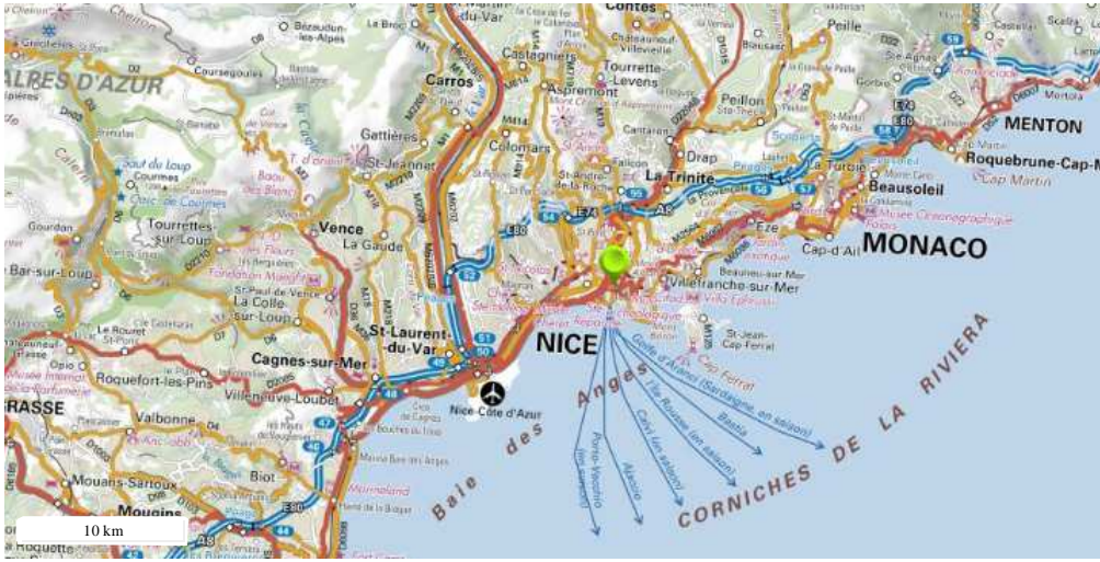
Périmètre du SIS Cartes IGN - IGN